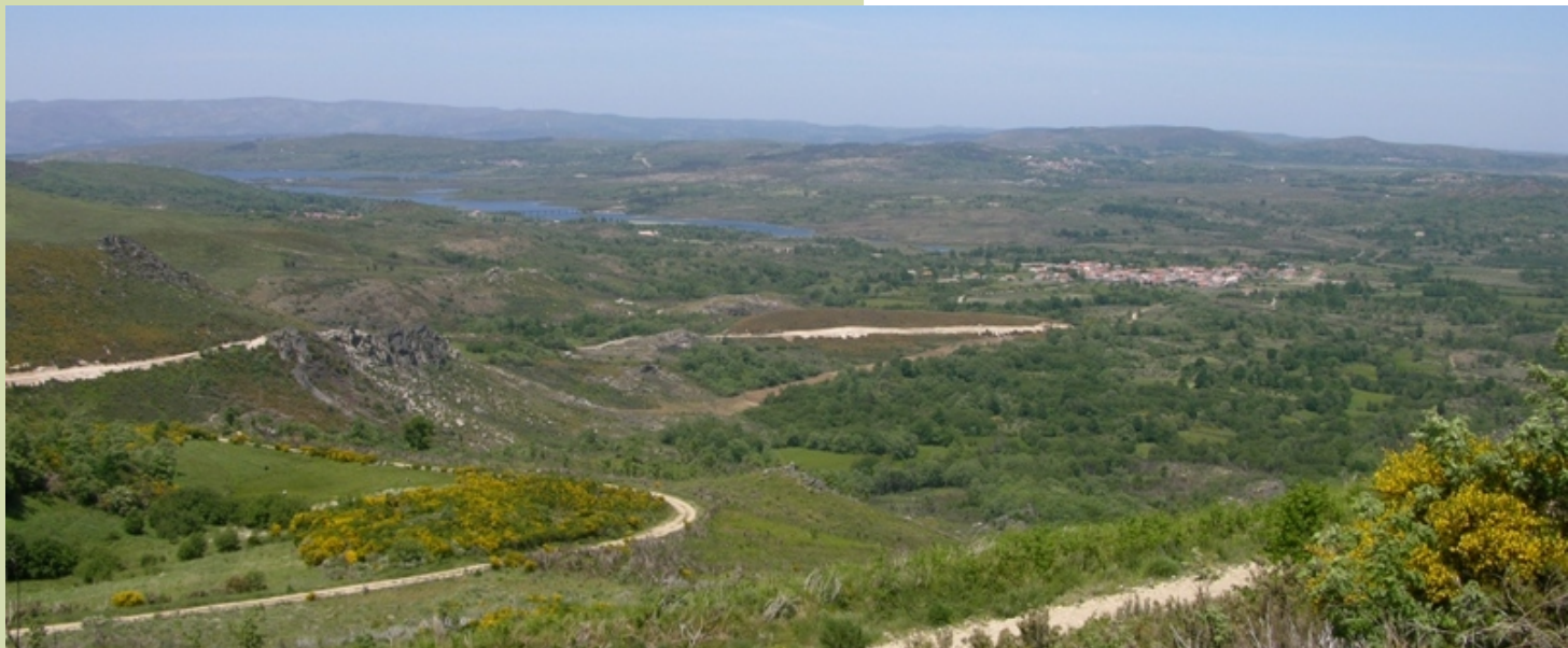
Vista dede os cumes da Serra da Pena cara a Portugal