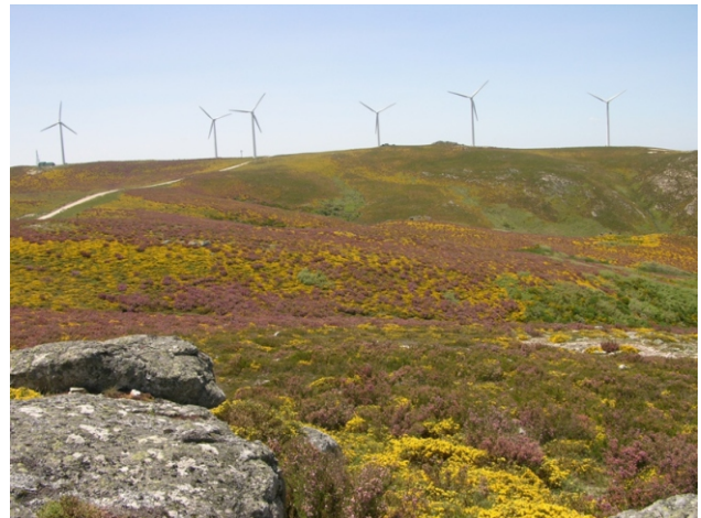
Cumes da Serra da Pena

Unha ruta pola Serra da Pena, entre o concello de Calvos de Randín e Portugal, que forma parte do Parque Natural Baixa Limia-Serra do Xurés; de grande interese paisaxística e biolóxica. Desde os cumes hai unhas vistas espectaculares de toda a contorna, especialmente da serra do Xurés e dos vales do Salas e do Cávado.